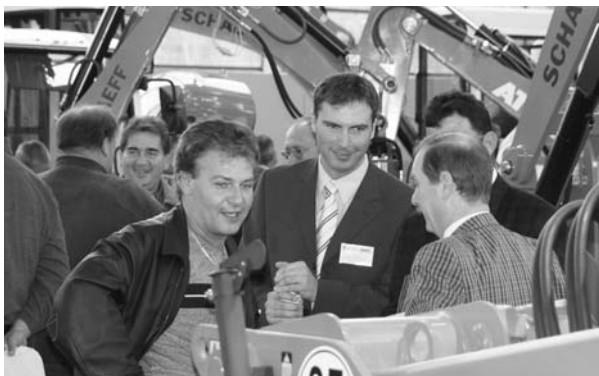
Messen wie die GaLaBau liefern Informationen im Überfluss.

Stellen werden sowohl vom öffentlichen Dienst als auch von Betrieben aus dem Garten-, Landschafts- und Sportplatzbau angeboten.